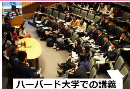
ハーバード大学での講義