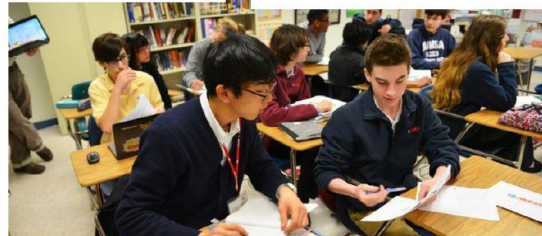
ボストンの高校：アメリカの高校生と一緒に授業を受ける